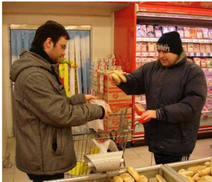
Asistent za klienty nedělá to, co zvládnou sami.

asistenta stejné věci, jako lidé bez postižení: chodit do práce, do školy, věnovat se svým volnočasovým aktivitám, zajít na kávu, na výstavu, na procházku nebo si nakoupit a vyřídit si své osobní záležitosti na úřadech nebo u lékaře. Asistent za ně ale nedělá to, co zvládnou sami. V uplynulém roce jsme poskytli 31 lidem 2 525 hodin asistence. Přitom máme stále volnou kapacitu – službu můžeme poskytnout ihned, bez čekání.