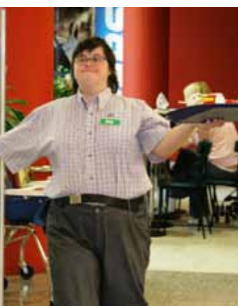
V roce 2013 jsme pomohli získat práci deseti lidem s mentálním postižením.