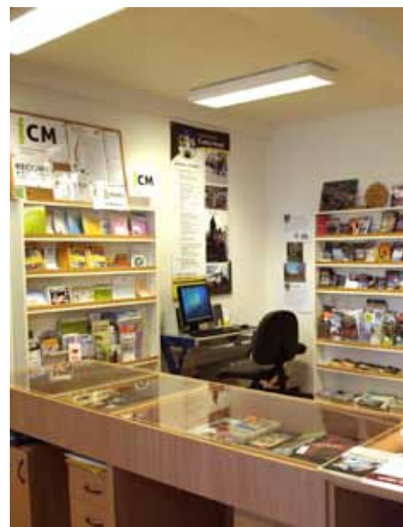
ICM Český Brod

no a ICM Slaný mohou letos získat certifikát poprvé. Uvedená ICM splnila náležitosti žádosti a byla zařazena do procesu certifikace. ICM Plzeň zaslalo neúplnou žádost po termínu a nesplnilo tak základní podmínky pro vstup do procesu certifikace. Kontroly naplňování standardů kvality ICM proběhnou v květnu a v červnu.