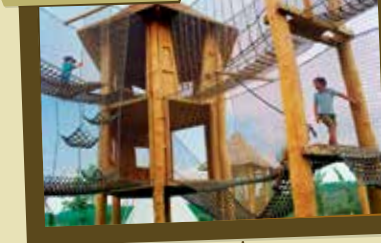
Lanový park Ekocentra