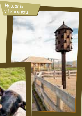
Holubník v Ekocentru