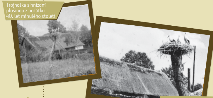
Hnízdo v Semtínku na starém ořechu z poloviny 30. let minulého století

Podpořte aktivity Ochrany fauny ČR na č.ú. 712781933/0300 nebo dárcovskou SMS ve tvaru DMS ZVIREVNOUZI HRACHOV na číslo 87777