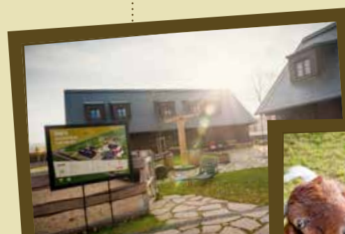
Budova Ekocentra Čapí hnízdo

Venkovní prostor, který navazuje na budovu, je pak řešen stylem poznávací expozice bylinkové zahrádky a vesnického dvorku s kontaktními domácími zvířaty (kozy, ovce, králíci atd.). Atmosféru venkovského dvorku pak podtrhuje holubník a roubená studna. Taktéž je pro návštěvníky Ekocentra k dispozici lanový park a lze si prohlédnout i zajímavost – pavilon lemurů.