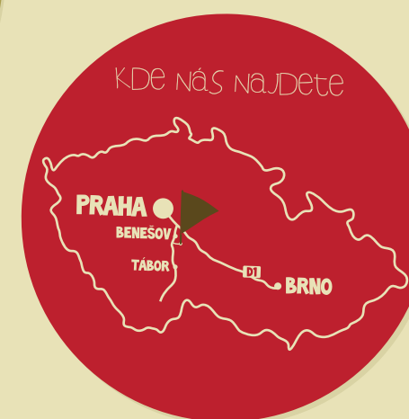
KDE NÁS NAJDETE

POZNÁVÁME TAJEMSTVÍ PŘÍRODY V SOUVISLOSTECH.