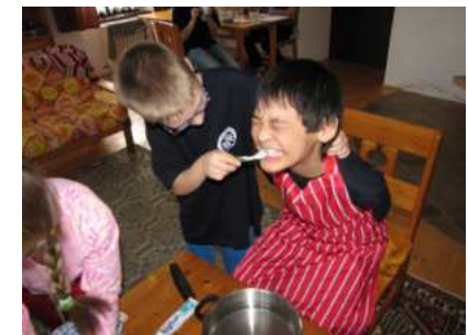
14. Přední hlídka Royal Rangers